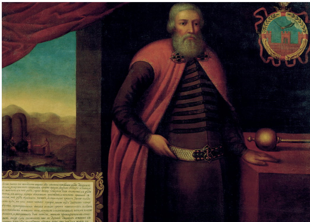
Илл. 2. Григорий Адольский. Портрет воеводы Ивана Власова. 1695 г.