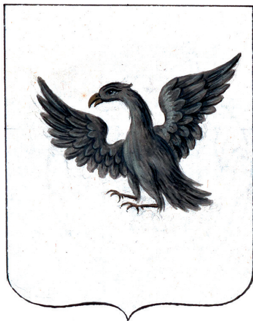
Илл. 2. Оригинальное изображение герба Нерчинска в сенатском докладе 1790 г. об утверждении гербов Иркутского наместничества