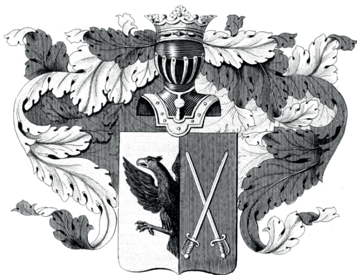
Илл. 1. Герб рода Толбузиных из VII части «Общего Российского Гербовника»